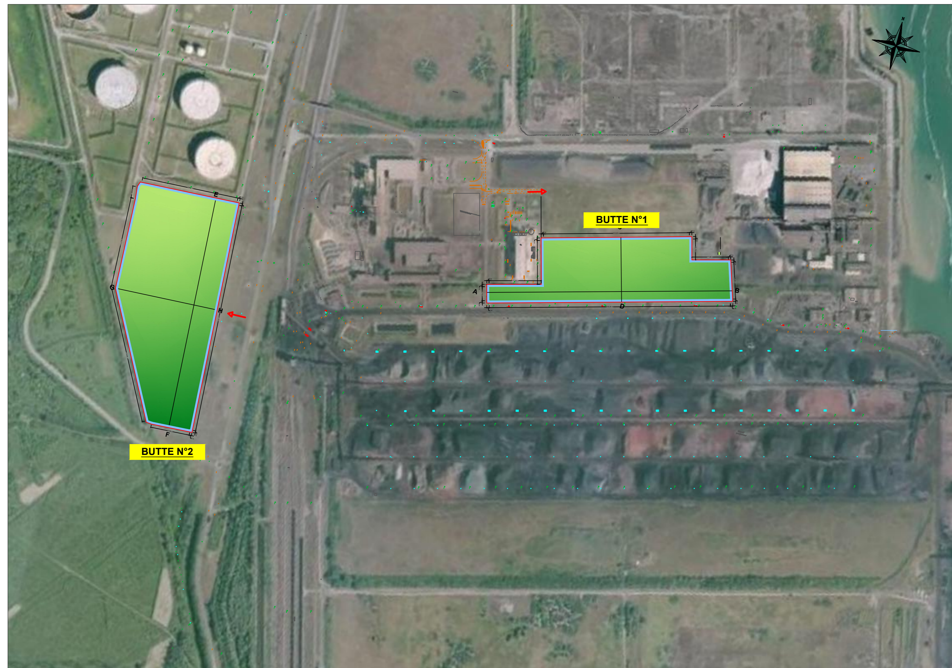
LOCALISATION DES BUTTES - 1/5000